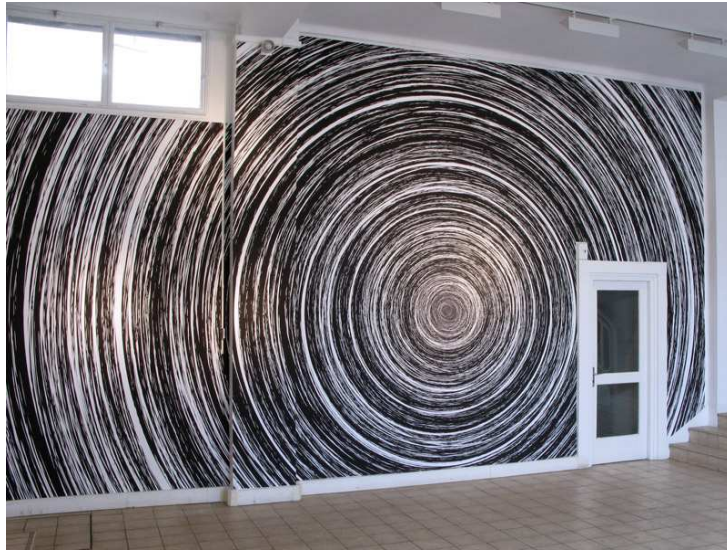
Spin, 2008 - Galerie Municipale, Vitry-sur-Seine, FR Impression numérique murale in situ, 15 m x 4,30 m