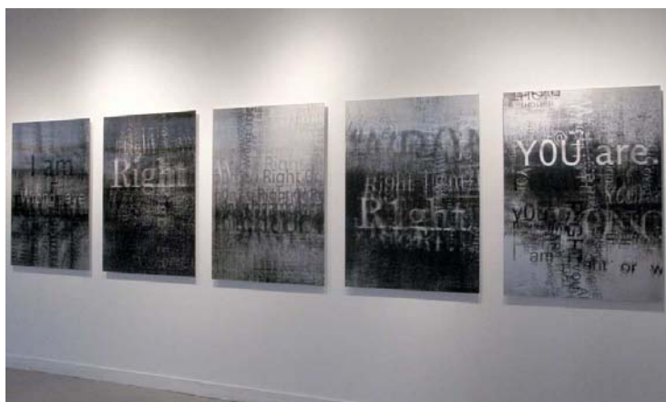
RightRong, 2008 - Impression Lenticulaire - 0.90 x 1.20 m (chaque)