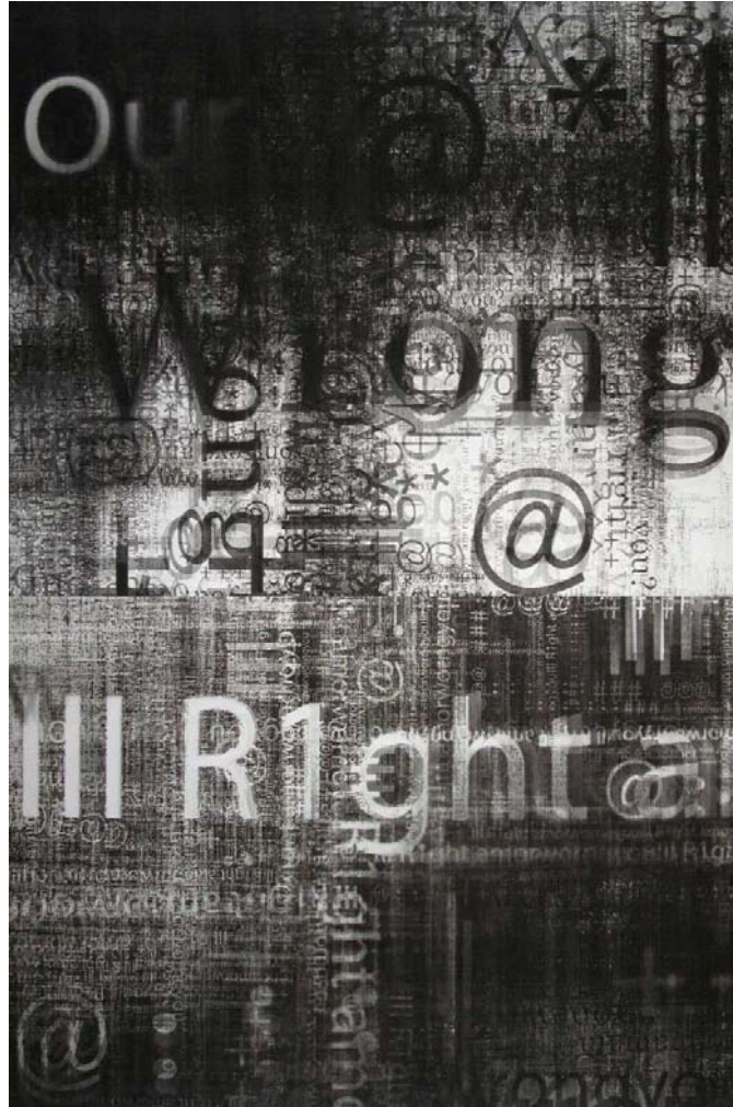
RightRong, 2008 - Impression Lenticulaire - 1,20x 1,80 m